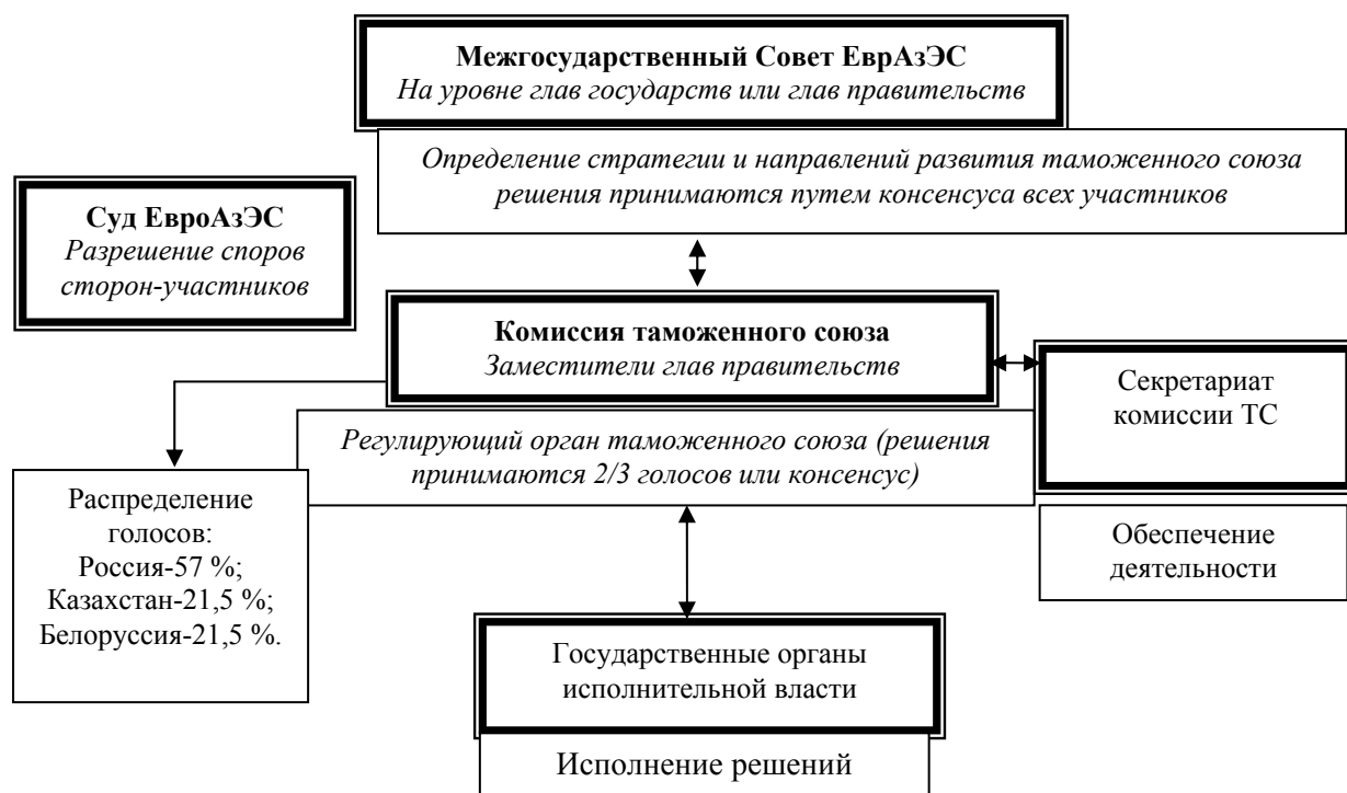
Рис. Система органов управления Таможенным союзом

На рисунке представлена система управления Таможенным союзом.